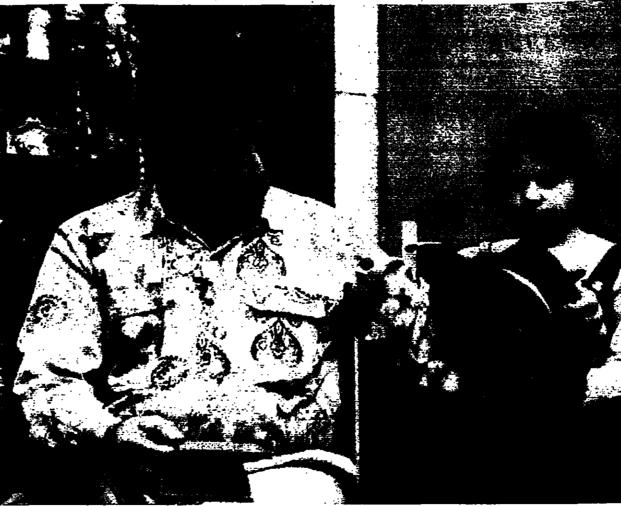
الطيار العراقي في ابنته في منزلها ببغداد

واشنطن - والقدس العربي: قال مسؤول في المخابرات الامريكية (سي آي ايه) جون غانغون اننا نعلم ان العراق يمتلك اسلحة كيمياوية وبيولوجية وانه يخطط لانتاج المزيد منها. وقال غانغون ان العراق يمتلك اسلحة كيمياوية وبيولوجية وانه يخطط لانتاج المزيد منها. وقال غانغون ان العراق يمتلك اسلحة كيمياوية وبيولوجية وانه يخطط لانتاج المزيد منها.